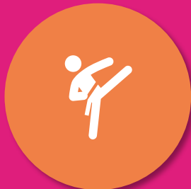
Karate & Judo