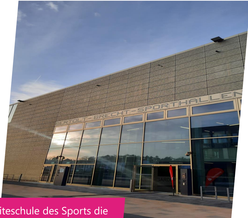
Eliteschule des Sports die Bertolt-Brecht-Schule

Die Eliteschule des Sports beheimatet 13 verschiedene Sportarten und Sportlerinnen auf höchstem sportlichen Niveau.