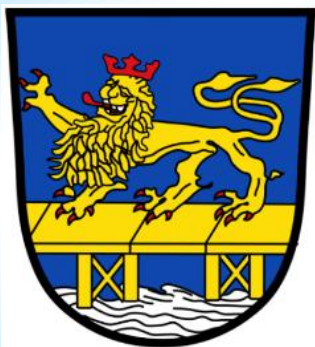
Markt Bruck i.d.OPf.